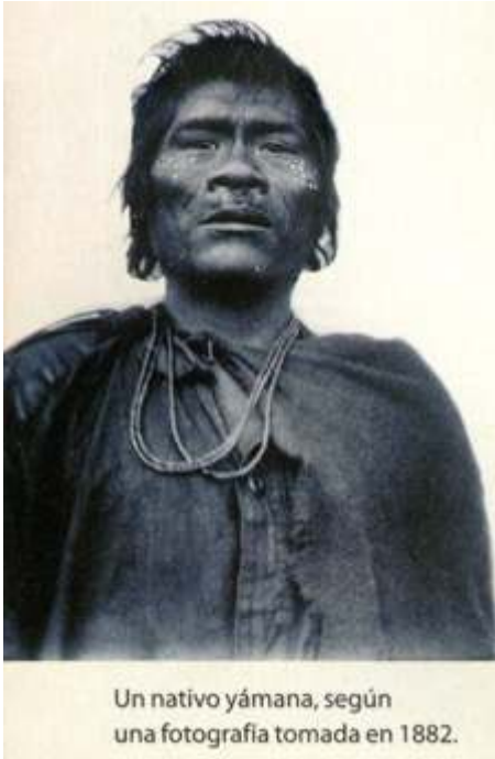
Imagen 1. “Un nativo yámana, según una fotografía tomada en 1882”, Manual Tinta Fresca, Ciencias Sociales 4, 2006, p. 92.

conjurar prolijamente el lenguaje racial, al tiempo que presentar a los “indígenas actuales” mediante la tecnología visual racializada del “tipo”.