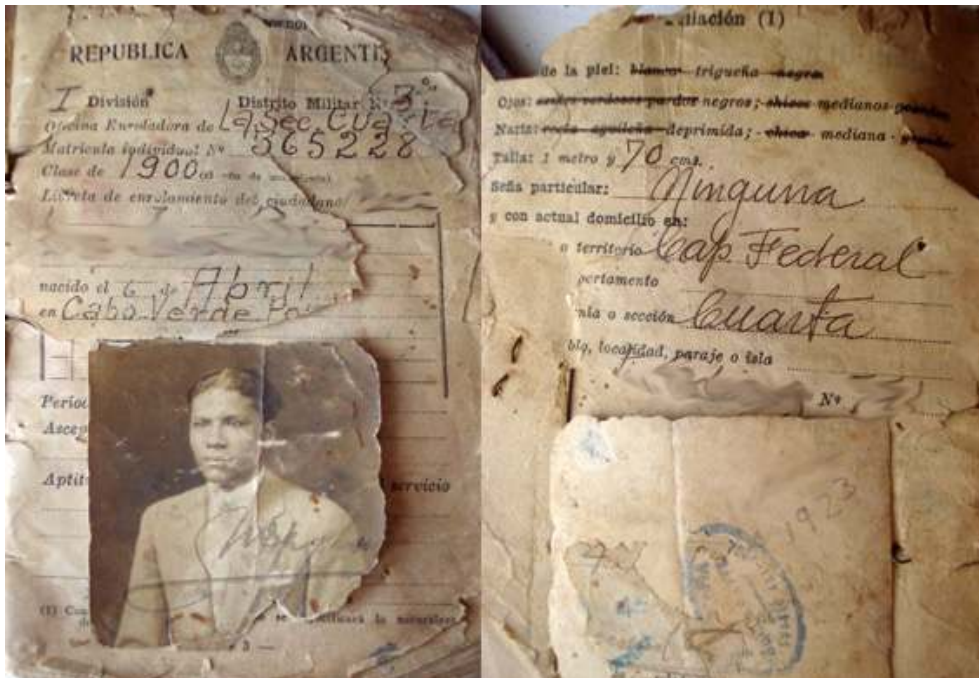
Imagen 5: Libreta de Enrolamiento. Año 1930 (aprox.). Se observa la denominación "trigueño", junto a otras descripciones físicas.

ámbitos de su vida cotidiana. Las fotografías 11 que a continuación se muestran dan cuenta de la vigencia de esta denominación en el tiempo.