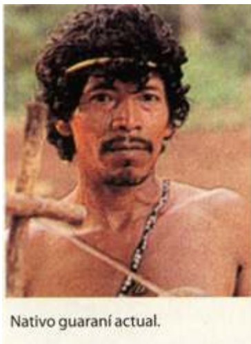
Imagen 2. “Nativo guaraní actual”, Manual Tinta Fresca, Ciencias Sociales 4, 2006, p. 95.